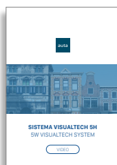
VIDEO Visualtech 5H