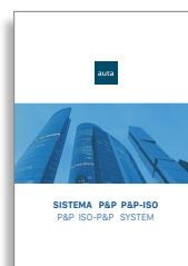
Sistema P&P P&P-ISO