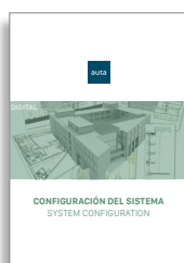
Configuración del Sistema