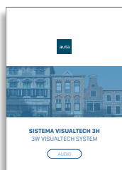
AUDIO Visualtech 3H